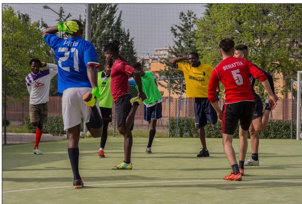
Gli allenamenti del Real Mezzanone alla Casa del Giovane "Emmaus" di Foggia.