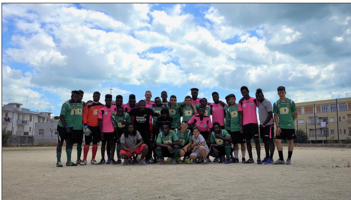
La squadra del Real Mezzanone in trasferta a Siponto.

UFFICIO STAMPA: MAD - Memorie Audiovisive della Daunia